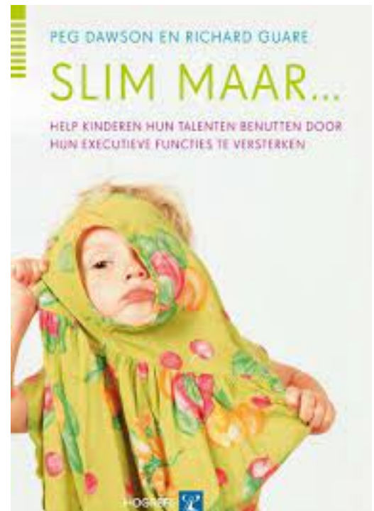
Peg Dawson; Slim maar