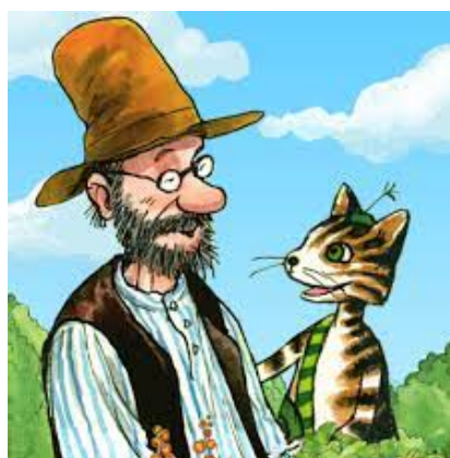
App: Pettson en Findus